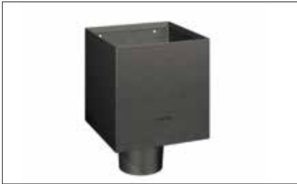
Boîte à eau carrée