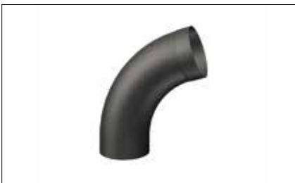
Coude tulipé/soudé/lyonnais/carré/ à onglet/à étage