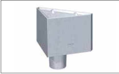
Boîte à eau triangulaire de face/d'angle