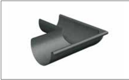
Équerre 1/2 ronde, extérieure/intérieure