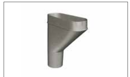
Cuvette de branchement