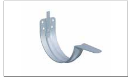
Crochet Différentes formes pour tout type de gouttières