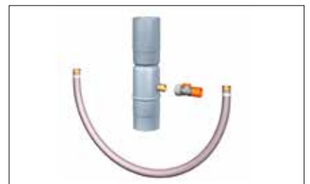
Récupérateur d'eau avec raccord GARDENA® Aqua Stop/ à clapet