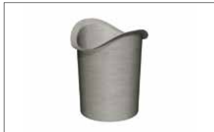
Naissance à souder cylindrique/plate/carrée/nice/ oblique