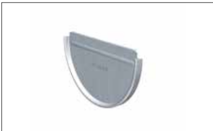
Talon à souder/carré/mouluré emboîtable/agrafable/à oreille