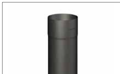
Tuyau de descente tulipe/soudé/carré