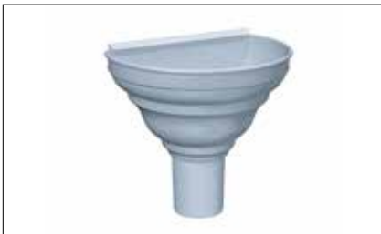
Cuvette 1/2 ronde de face/d'angle