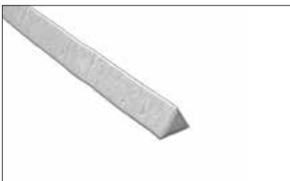
Étain sans plomb