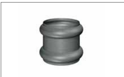
Bague extensible simple/extensible double/ spirale/à souder