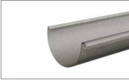
Gouttière 1/2 ronde/lyonnaise/anglaise