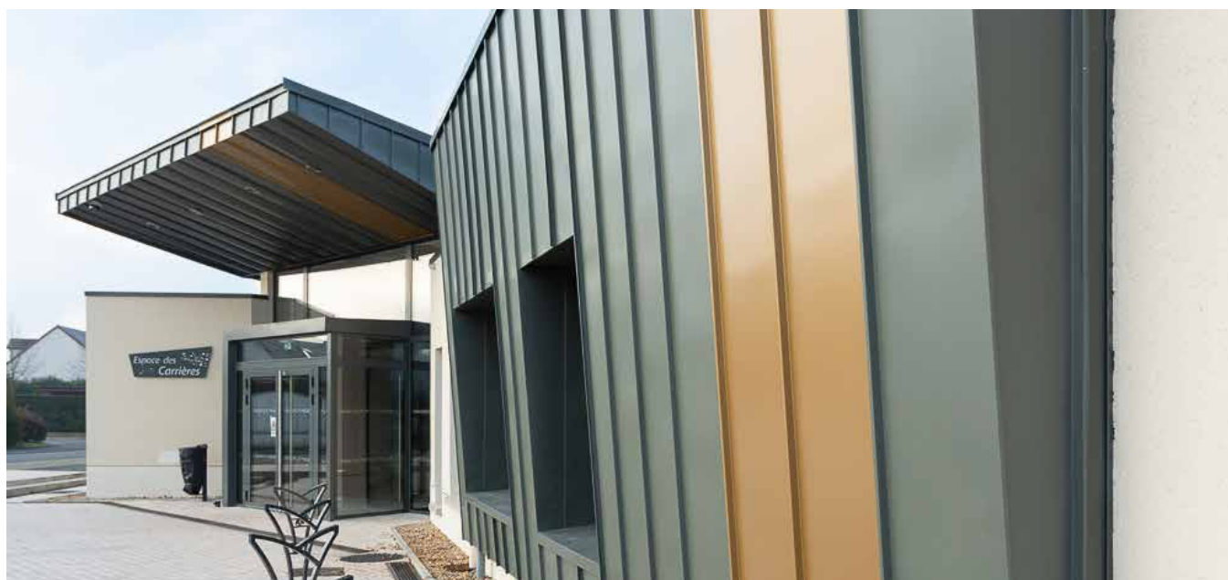
École de Musique d'Ormes - Maître d'œuvre : V+C Architecture

Entretien avec Aurélié Rouquette, décembre 2020 Propos recueillis par Margaux Oudinet - C&M Prod. pour RHEINZINK