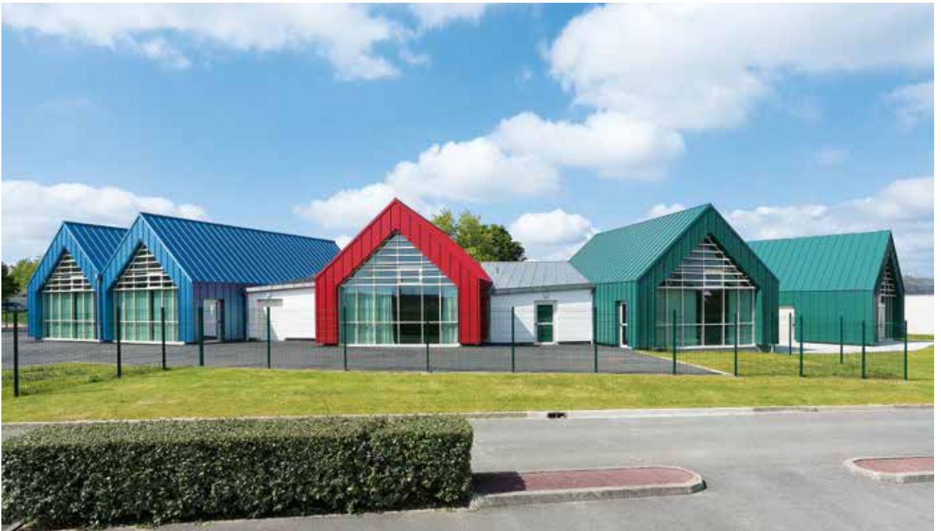
Accueil de loisirs et garderie périscolaire, Dampierre en Burly - Maître d'œuvre : CS Architecture eurl