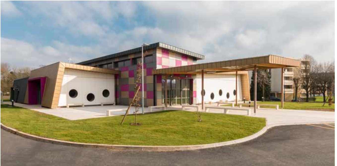
Restaurant scolaire de Villers Cotterêt - Maître d'œuvre : Paulin Bernard Crédit : Manuel Panaget

LA COULEUR DANS L'ARCHITECTURE CONTEMPORAINE